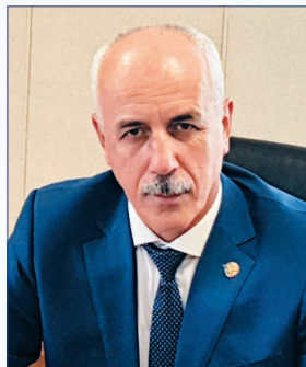
Гаджиев Магомедэмин Нурутдинович Президент ДФГС