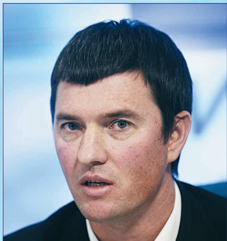
Президент федерации гребного спорта России, Олимпийский чемпион Алексей Свирин