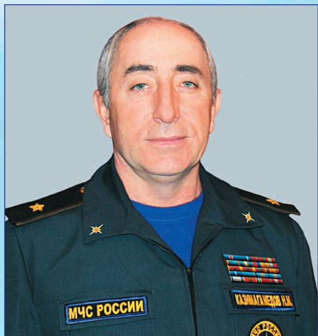
Начальник ГУ МЧС России по РД генерал-майор Нариман Казимагамедов